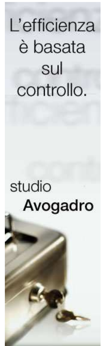
Skyscraper largo (160 x 600)