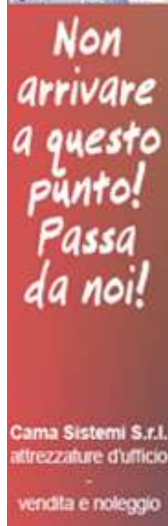
Skyscraper (120 x 600)