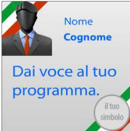
Quadrato (250 x 250)