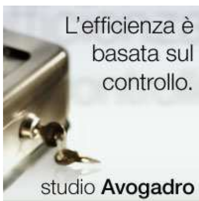
Quadrato piccolo (200 x 200)